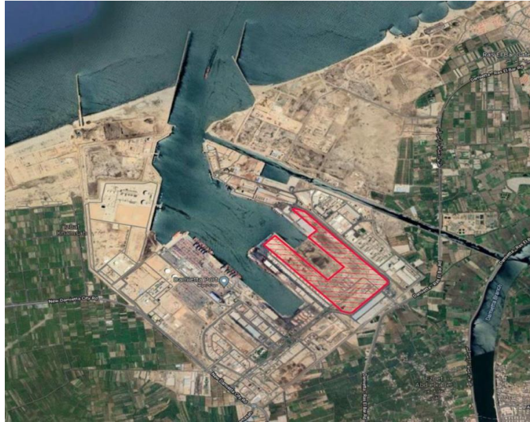
Figure 2 – Map of the CT2