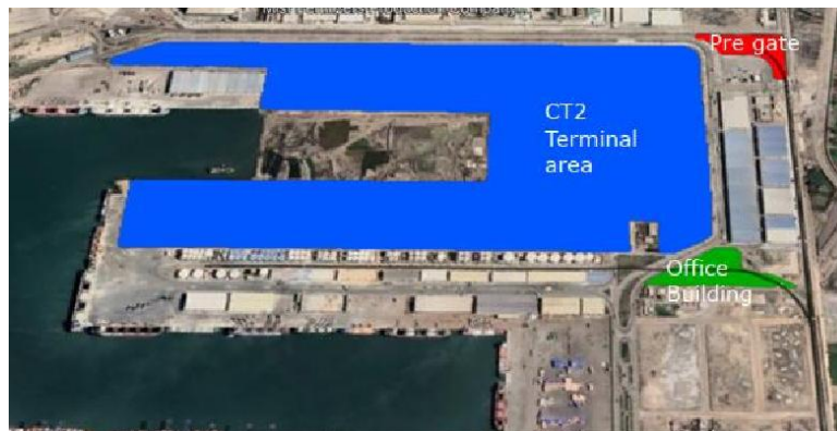
الشكل 2 – خريطة محطة الحاويات 2

The DPA currently operates thirteen docks/berths and six terminals at Damietta Port, handling export of agricultural products, fertilizers, and furniture and import of goods such as petrochemicals, cement, grains, flour, and general cargo, as well as containers.